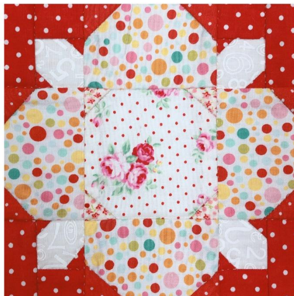
【範例五】 本範例為錯誤示範，明度差異不足，凸顯不出圖案效果。