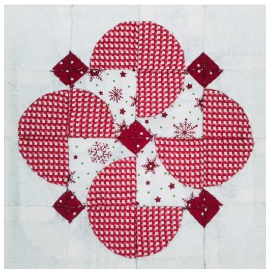
↑ 【範例一】 白色底