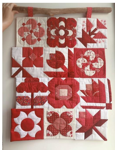
↑ 【範例三】 小型壁飾拼接效果