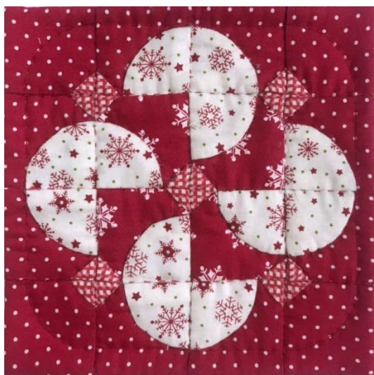
↑ 【範例一】 紅色底